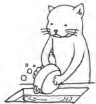
ねこのクスコ 鼻歌まじりにどんなことも 楽しくできちゃう