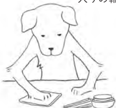
いぬのジョホールバル 無口だけどいつも楽しい 冗談を考えている