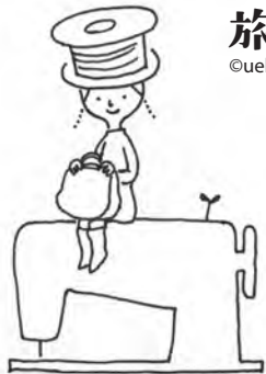
ミシンさん 旅が好きな旅上手。 好きな季節は初夏

Twitter Facebook Instagram @tabisurumishin