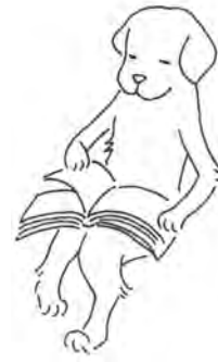
いぬのタイペイ 読書が大好き。 大きな図書館を つくるのが夢