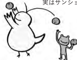
きょうりゅうくん いつもにこにこ朗らか。 実はサンショウウオらしい