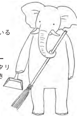
ぞうのワーラーナシー 掃除が大好き。ベジタリ アンなのは生まれつき