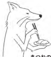
きつねの伏見さん いなり寿司評論家。 自身もつくる