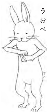
うさぎのユトレヒト おっとりとした性格。 ペランダでハーブを育てている