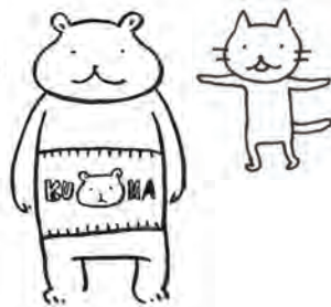
こねこ (こねこ・ナーンタリ) 元気いっぱい、鮭のハラスが好物。 実はユキヒョウらしいので絶滅危惧種