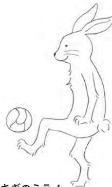
うさぎのミラノ リフティングの練習は日課。 晴れた日はいつも芝生広場 にいる