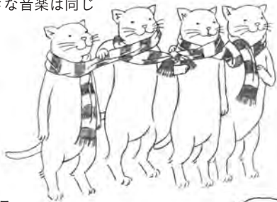
リヴァプール四兄弟 趣味も好物もそれぞれ違うけれど 好きな音楽は同じ