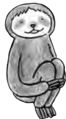
ナマケモノのマナウス 人に左右されないマイペースな エコロジスト